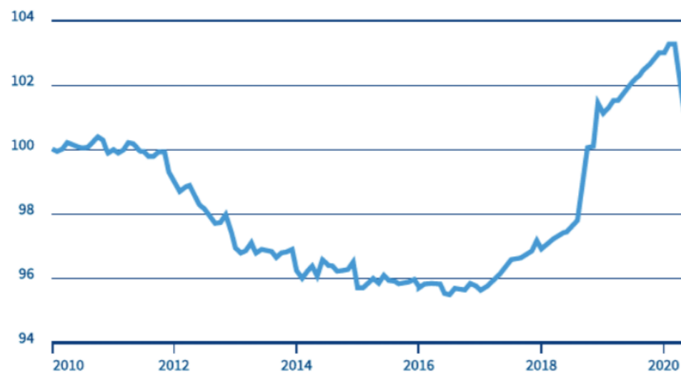
INDEKS CEN TRANAKCYJNYCH MIESZKAŃ W POLSCE

W wakacyjnym sezonie 2020 Mazury zanotowały rekordowe obłożenie. Popyt przewyższył podaż apartamentów położonych w lesie, w mazurskich krajobrazach z dala od zgiełku typowych kurortów wakacyjnych. Dlatego też Zapach Lasu jest doskonałą inwestycją finansową.